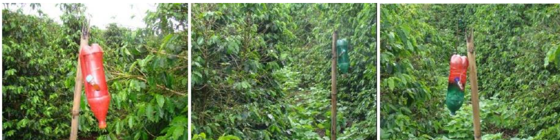
Figura 1. Armadilhas confeccionadas com garrafas PET de 2 L pintadas de vermelho, verde e colorida (vermelho+verde) com a mistura atrativa etanol:metanol na proporção 1:1 e 1:3 com pó de café, benzaldeído (0,5%) e ácido benzoico (1%) contidos em um frasco de plástico.

Os experimentos foram conduzidos em delineamento em blocos casualizados em fatorial duplo (3 x 6) com 6 repetições cada, com as cores: vermelho, verde e colorida (vermelho+verde) e seis misturas dos compostos voláteis (etanol:metanol + pó de café + benzaldeído + ácido benzoico) nas proporções: