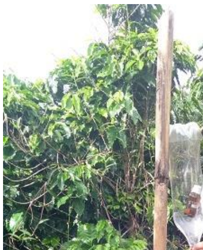
Figura 2. Armadilha à base de garrafa Pet de 2L transparente com a mistura Etanol: Cinamaldeído, proporção 1:1, para captura de Hypothenemus hampei.

As aberturas das armadilhas foram posicionadas para o centro da entre linha do café, para possibilitar que a pluma odorífera do atrativo se dispersasse entre as fileiras (FERNANDES et al., 2014). Foram distribuídas 50 armadilhas em toda a área, equidistantes (15x15m) ao longo de 10 blocos inteiramente casualizados, com cinco armadilhas por bloco com seus respectivos tratamentos. Cada ponto amostral foi previamente georreferenciado.