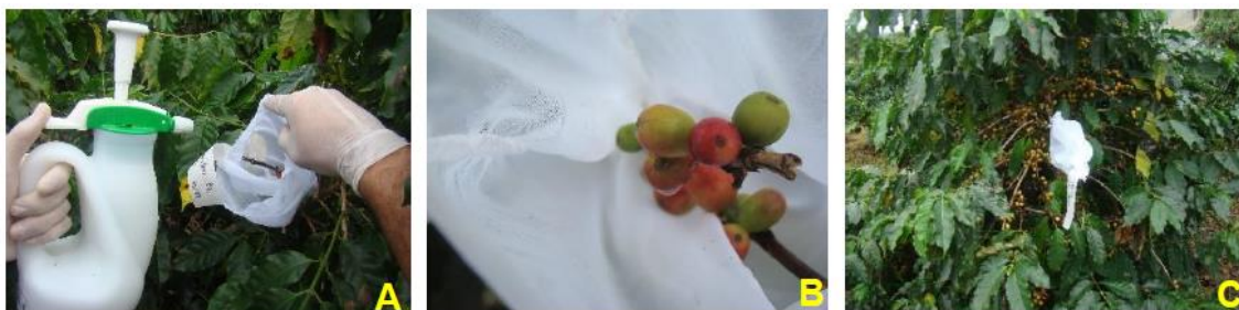
Figura 1. A - Aplicação do fungo B. bassiana associado aos emulsificantes sobre os frutos; B - Liberação da broca-do-café pós-aplicação dos produtos; C - Frutos ensacados com tecido Organza.

Os experimentos foram conduzidos em blocos ao acaso com cinco tratamentos (T1 - Goma arábica+ Beauveria , T2 - X1+ Beauveria , T3 - Goma+X1+ Beauveria , T4 - Beauveria pura) e Testemunha (água) com duas repetições por tratamento. Em cada experimento utilizou-se cinco blocos contendo todos os tratamentos.